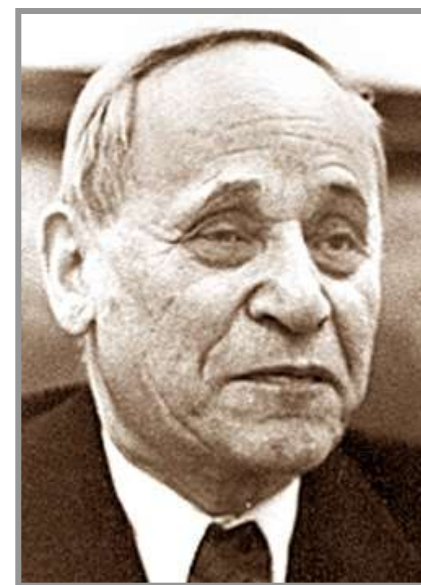
Вольф Соломонович Мерлин